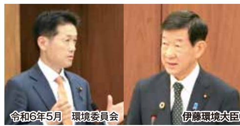
令和6年5月 環境委員会