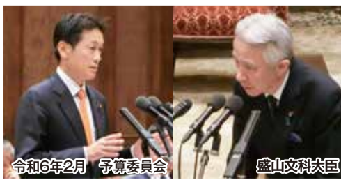
令和6年2月 予算委員会