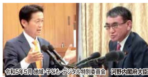
令和5年5月 地域・子ども・デジタル特別委員会 河野内閣府大臣